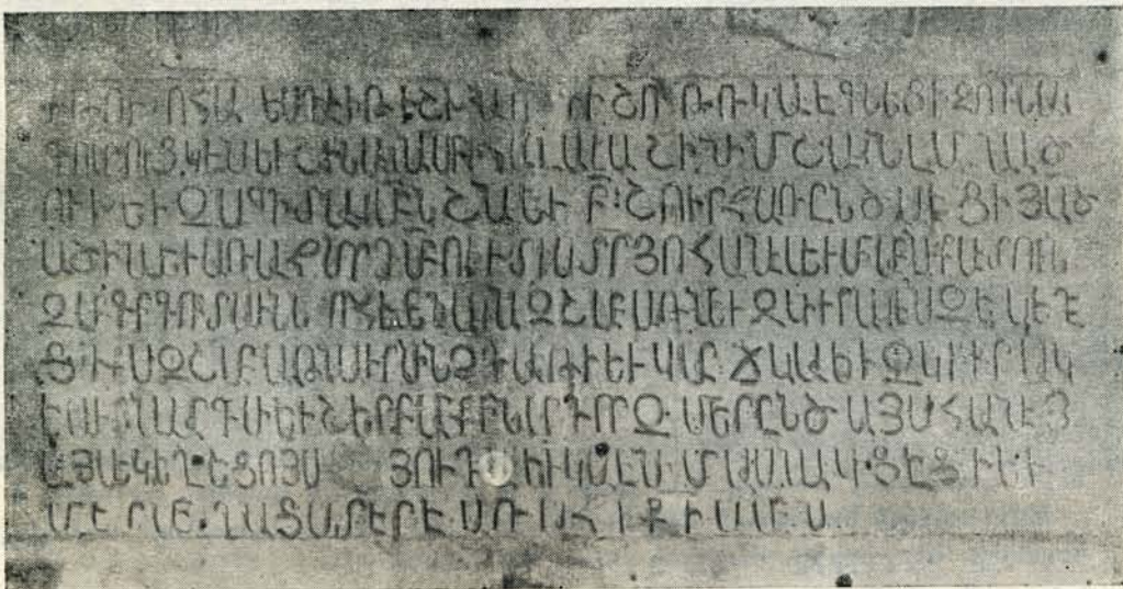
Նկ. 32. Արձ. № 15:

15. Ամենափրկչի ժամասան հս պատին դրսից, այժմ Աձածնա ժամասան մեջ, նախորդի մոտ