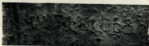
Նկ. 54. Արձ. № 69: