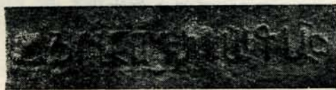
Նկ. 56. Արձ. № 74: