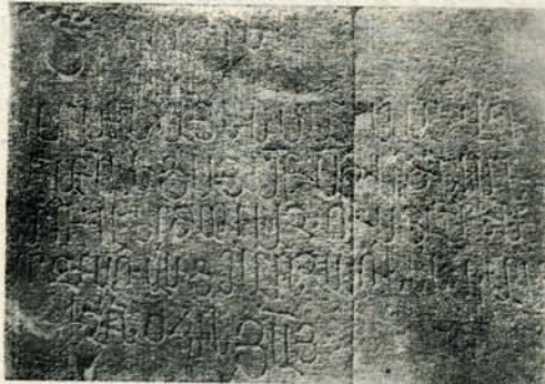
Նկ. 69. Արձ. № 112: