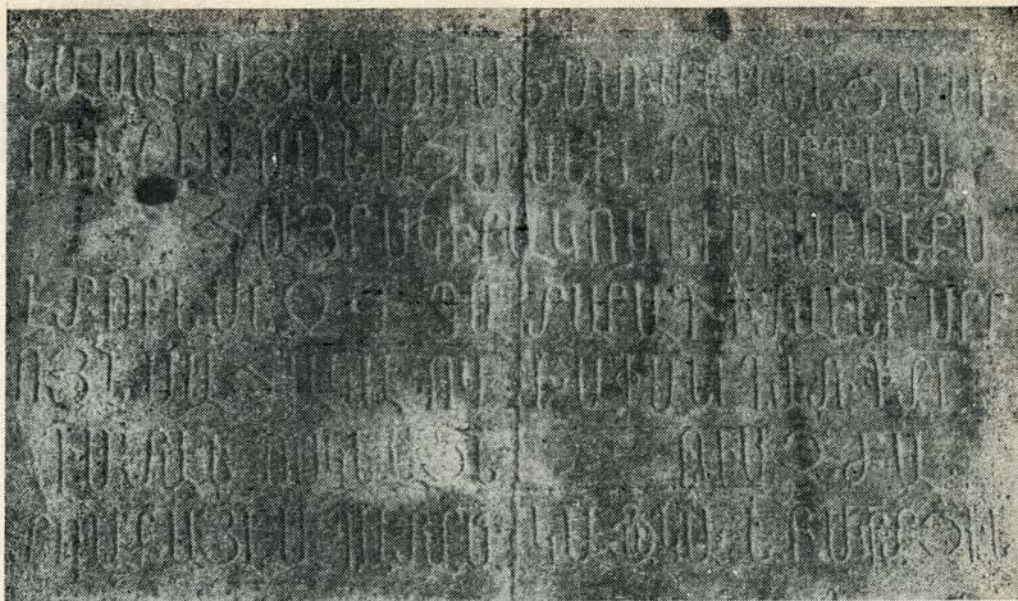
Նկ. 76. Արձ. №№ 120 և 122: