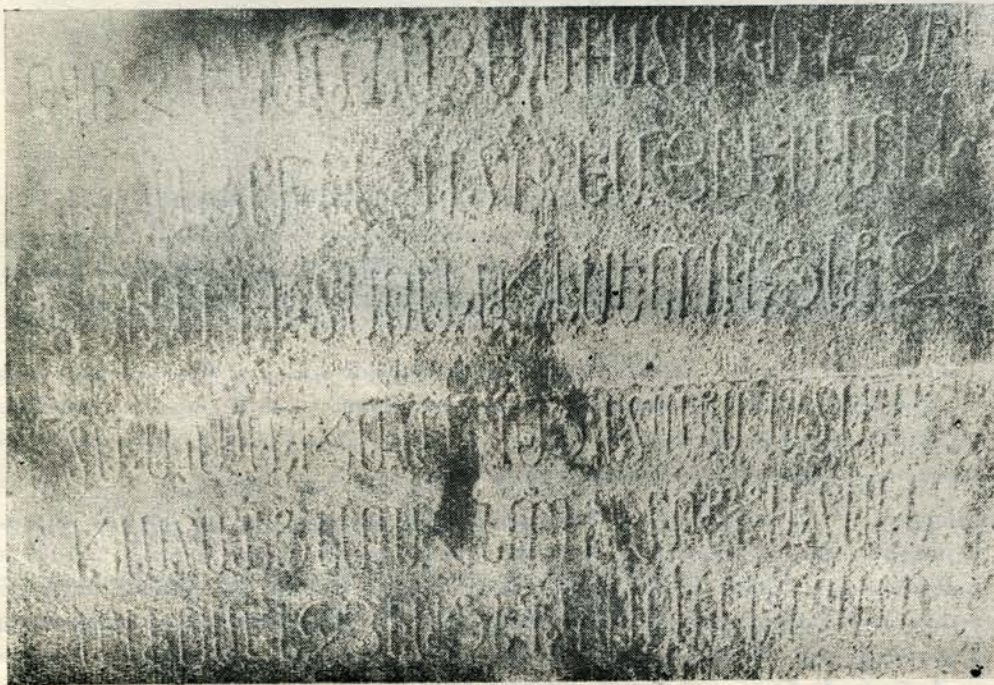
Նկ. 84. Արձ. № 132: