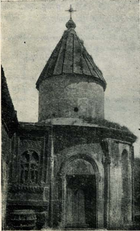
Նկ. 16. Ս. Գրիգոր եկեղեցին ամ կողմից:

որի բացվածքը 18 մետր է: Նա այժմյան Ալավերդի շրջանային կենտրոնում Գեբեդ գետի երկու ափերն է միացնում, որի վրայով այժմ էլ Ալավերդուց մարդիկ և ավտոմեքենաները գնում են Սանահին և այլ գյուղեր: Կամուրջի աջակողմյան հիմքը դրված է